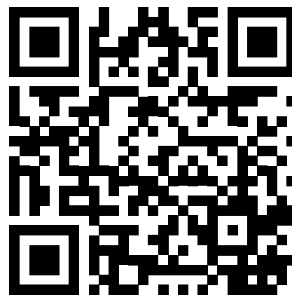
OFFICINA DELLA SCALA WEBSITE