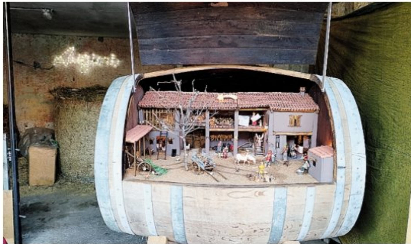
Uno dei presepi del cortile Boschi in centro a Cologno al Serio

A corredo della Natività principale, disposta su due livelli sotto i portici della cascina, ci sono altre piccole Natività tematiche (tra cui un presepe realizzato in una vecchia botte di vino con la riproduzione del cortile com'era negli Anni Cinquanta) a cui anche quest'anno si affiancherà un ricco programma di iniziative collaterali di solidarietà e beneficenza. Il debutto è avven