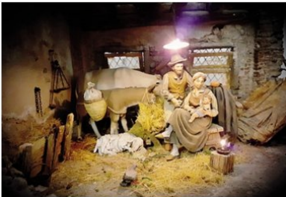
Uno dei presepi in mostra al centro «Don Milani»

Zanica La mostra tra le iniziative clou del calendario di eventi promosso per le feste natalizie