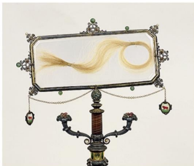
La teca contenente i capelli di Lucrezia Borgia (1480-1519)

La rassegna continua con i fogli autografi di Gaetana Agnesi (Milano, 1718-1799) una delle più importanti matematiche di tutti i tempi, prima donna a ottenere una cattedra universitaria di matematica e si chiude alcuni fogli donati dalla poetessa milanese Alda Merini (1931-2009) al Cardinal Gianfranco Ravasi.