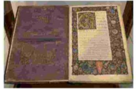
A sinistra, l'interno della biblioteca. In alto, il volume con la Guerra Gallica di Giulio Cesare