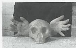
INTENSA L'artista serba Marina Abramovic

realizzò in un ex convento di suore chiarisse a Gijón, nelle Asturie: fino al 1996 le suore accolsero i ragazzi orfani, figli dei minatori locali.