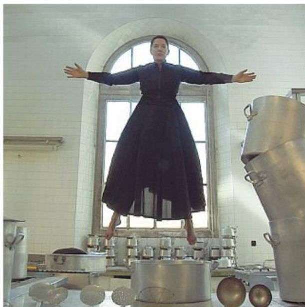
Sorprendente L'artista serba Marina Abramovic in uno dei tre video che compongono «Estasi»