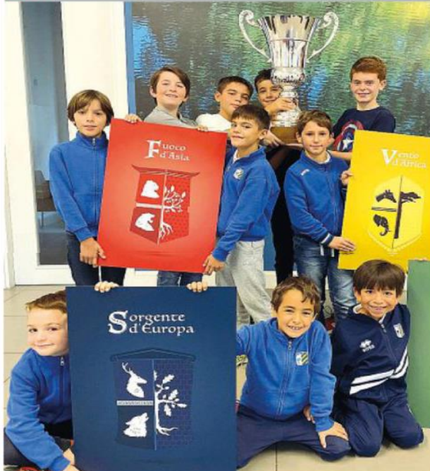
Stemmi Alcuni ragazzi della scuola Faes dove, per gli alunni fino ai 13 anni, inizia la sperimentazione in stile College