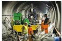
Galleria Il cantiere di restyling sulla M2