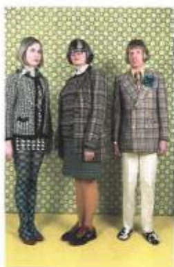
Sopra, una foto di Martin Parr: "The Perry Family - daughter Florence, Philippa and Grayson", London, England, 2012. Sotto, "The last supper" di Andy Warhol.