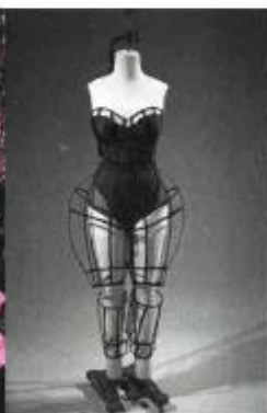
Sopra, a New York uno dei modelli della mostra "Exhibitionism: 50 years of The Museum": Chromat, ensemble, spring 2015.

LIBRI A CURA DI ANDREA BARROZZI, MODA A CURA DI SARA FRANCHI, HARNO COLLABORATO CLAUDIA CAROLI, MARIACRISTINA FERRAIOLI, ALESSANDRA MANTONA, LORENZA NEGRI, FOTO © MARTIN PARR/MAGNUM PHOTOS/ROCKET GALLERY, © THE MUSEUM AT FIT, COLLEZIONE CREVAL (ANDY WARHOL), FRANCESCO PRANDONI PER GENTILE CONCESSIONE DI VIVO CONCONTI (THE JOURNALIST).