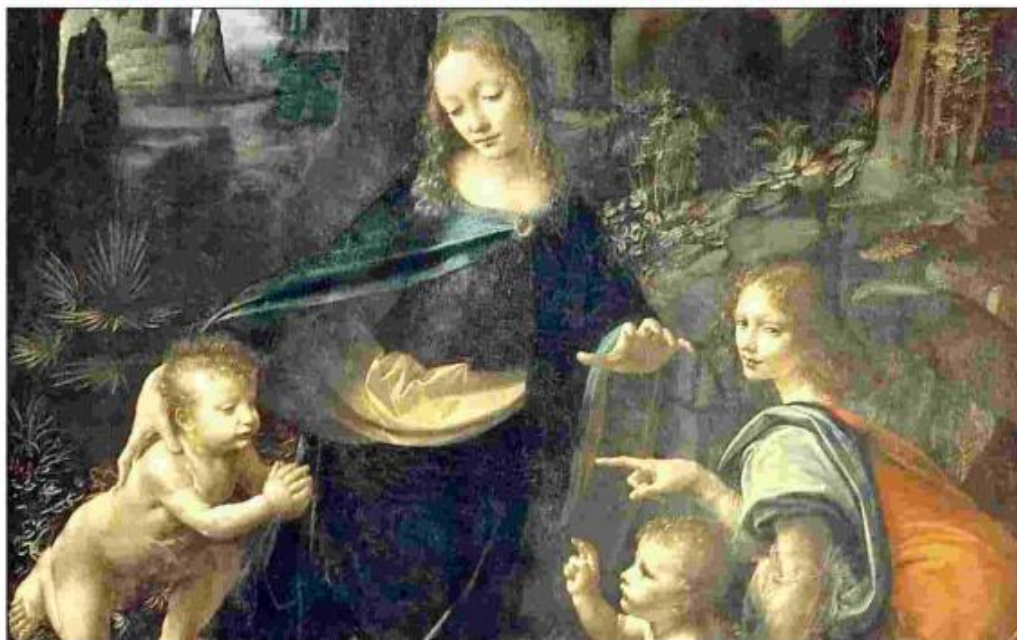
"La Vergine delle rocce" (1483-1486) di Leonardo da Vinci; a destra in alto, dipinto di Boldini e, sotto, Anna Magnani sulla spiaggia del Circeo