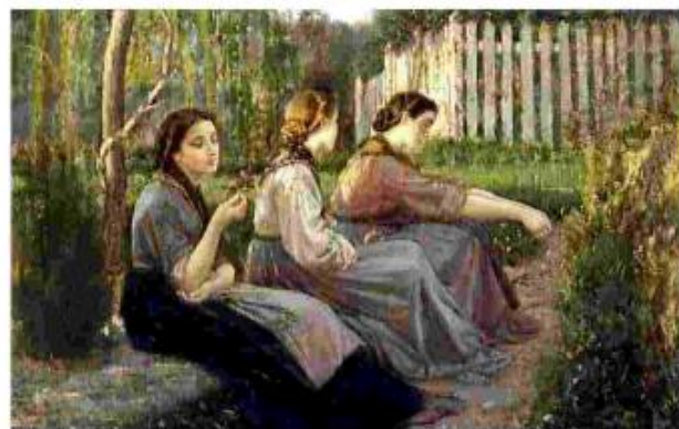
"Confidenze" opera di Cristiano Banti, mostra "Lessico femminile"