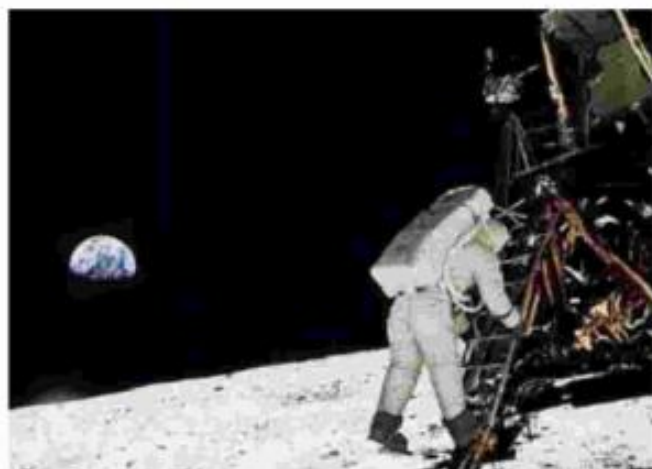
Apollo 11 portò gli uomini sulla Luna: era il 20 luglio 1969 alle 20.18