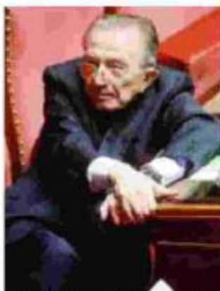
Giulio Andreotti (1919-2013)