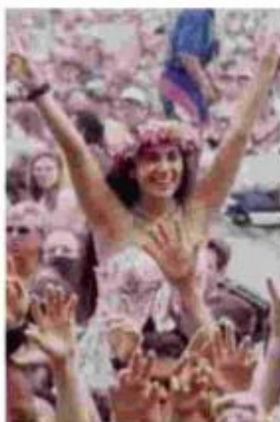
Il raduno di Woodstock