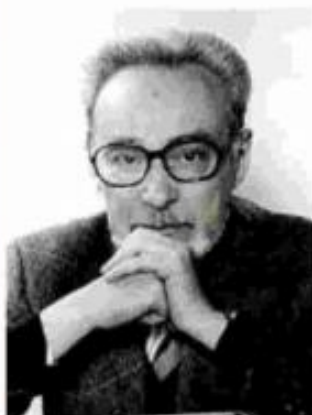
Primo Levi (1919-1987)