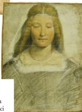
Qui sopra, Giovanni Antonio Boltraffio (1467-1516), Studio di figura femminile (1498-1502), in mostra alla Pinacoteca Ambrosiana a Milano. In alto a sinistra, Leonardo da Vinci, foglio del Codice Leicester in mostra a Firenze.

“Sempre caro mi fu quest'ermo colle/e questa siepe che da tanta parte/dell'ultimo orizzonte il guardo esclude” (G. Leopardi, L'infinito , 1819)