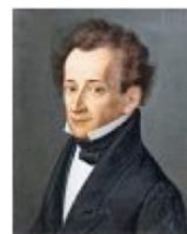
Giovanni Gallucci, Ritratto di Giacomo Leopardi (1815), Collezione Comune di Recanati.

FINO AL 19 MAGGIO , INFINITÀ IMMENSITÀ. IL MANOSCRITTO E MARIO GIACOMELLI. GIACOMO LEOPARDI. DAL 30 GIUGNO , INFINITI E FINITO, NON FINITO E INFINITO. INFINITORECANATI.IT