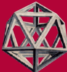
Maimonide e la Tradizione Araba