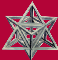
Maimonide e la Tradizione Ebraica